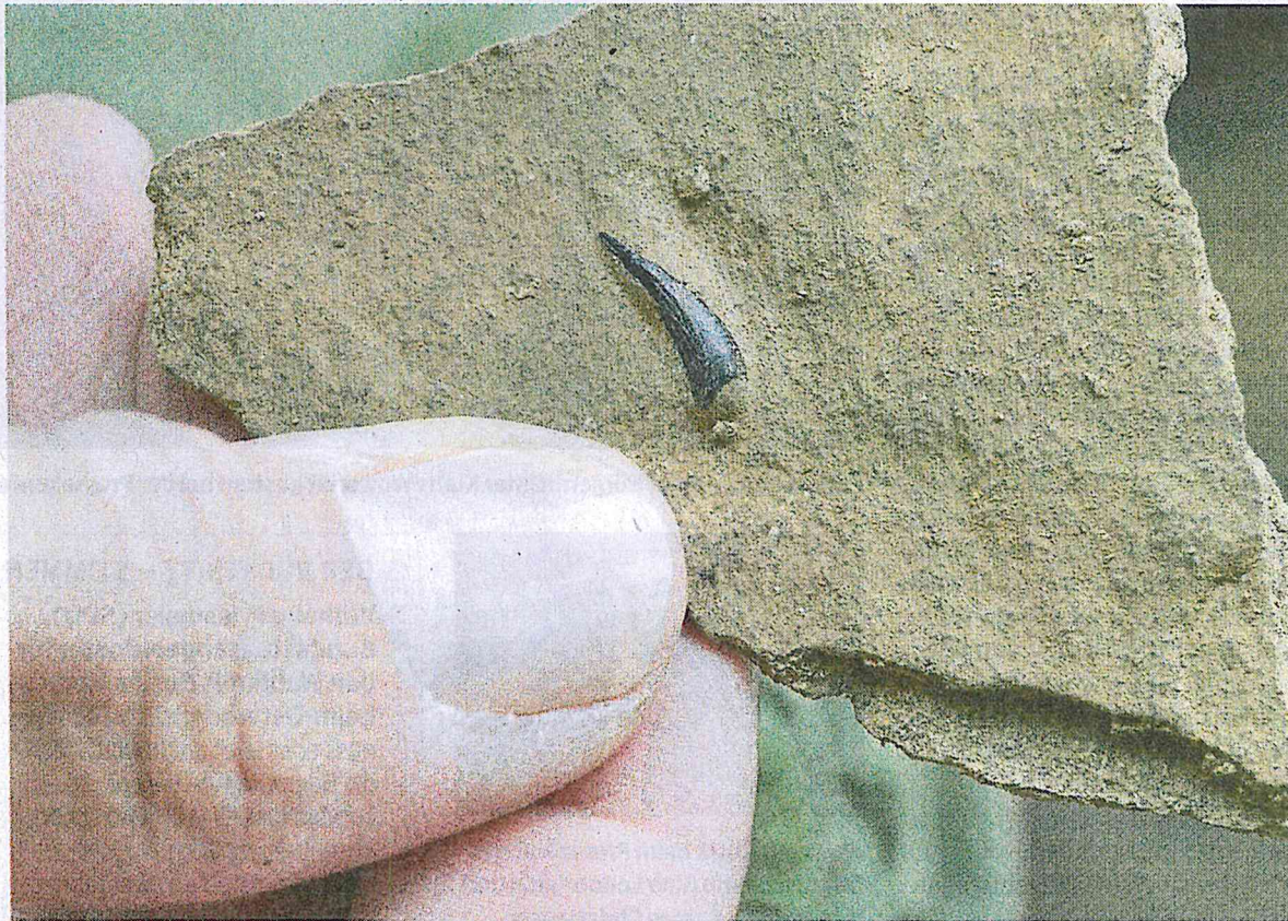
Dieser Zahn, den Studenten bei Schandelah fanden, gehört vermutlich zu einem Flugsaurier.

Am Montag hatte ein Team von sieben Biologiestudenten und zwei Praktikanten der Technischen Universität (TU) Braunschweig unter der Leitung von Sebastian Radecker, dem geologischen und paläontologischen Präparator des Naturhistorischen Museums Braunschweig, mit den Grabungen begonnen. Gleich am zweiten Tag der Grabung fanden sie den Zahn.